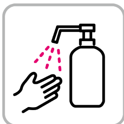
アルコール消毒液の配置 Installation of alcohol disinfectant