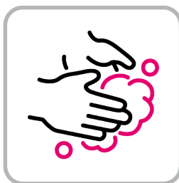
手洗いの徹底 Practice proper handwashing