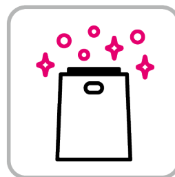
空気清浄機の設置 Installation of air purifier